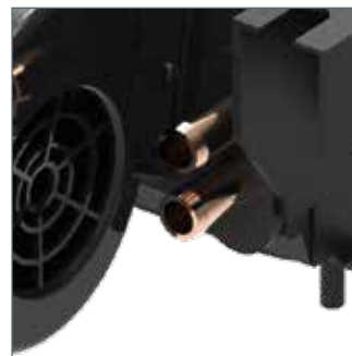
Water connector diameter 16 mm